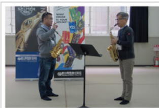
講師陣による 個人レッスンで 実力アップ!