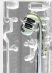
ウィスパークー& C#キーローラー