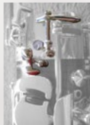
右手用ウィスパークー ロック