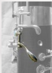
右中指用 C# キー