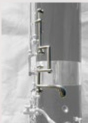
右手用 E♭ キー