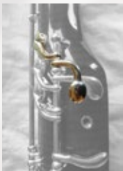
High F キー