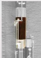
ショートカットモデル