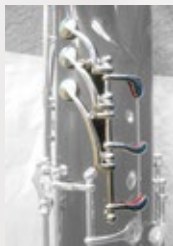
High E キー / E♭ トリルキー ローマウントバージョン (写真は High F キー付)