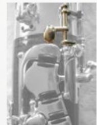
右親指用ウィスパークー