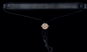
ネックストラップ

コンパクト且つ快適に背負えるタイプ(バックストラップ付)で、大きな収納スペースと、2つの取り外し可能なポーチが付属。ケースの色はサクソフォンのネックの”S”の色を彷彿とさせるナイトブルー仕様。