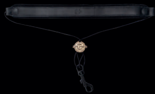
ネックストラップ

コンパクト且つ快適に背負えるタイプ(バックストラップ付)で、大きな収納スペースと、2つの取り外し可能なポーチが付属。 ケースの色はサクソフォンのネックの”S”の色を彷彿とさせるナイトブルー仕様。