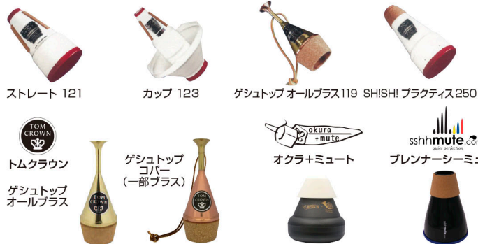
ストレート 121 カップ 123 ゲシュトップ オールグラス119 SHISHI プラクティス250