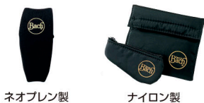
ネオプレン製 ナイロン製