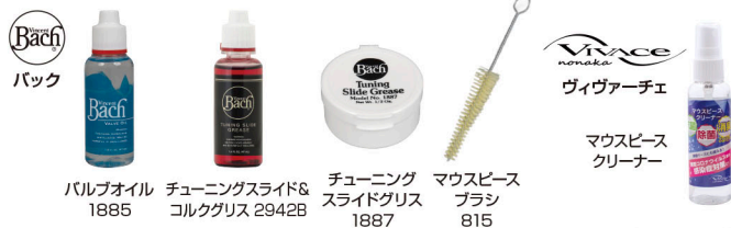
パルブオイル 1885 チューニングスライド& コルクグリス 2942B チューニング スライドグリス 1887 マウスピース ブラシ 815