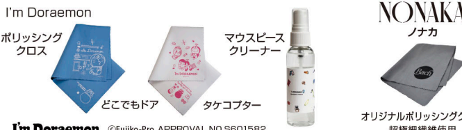
I'm Doraemon どこでもドア タケコブター ©Fujiko-Pro APPROVAL NO.S601582

仕様、付属品は予告なしに変更される場合があります。モデルによっては納期を必要とする場合があります。ご了承ください。