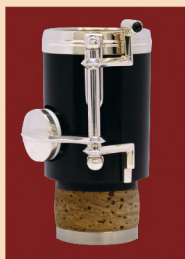
● オプション LowB b エクステンション

定評のある深い響きがマリゴイングリッシュホルンの最大の魅力。近年加えられた改良により、操作性や表現力が飛躍的に向上しました。