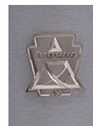
Brushed Grey Cortex