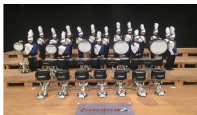
駒澤大学附属苫小牧高等学校 吹奏楽局“Shelties”