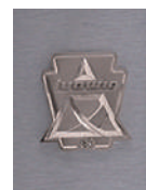
Brushed Grey Cortex