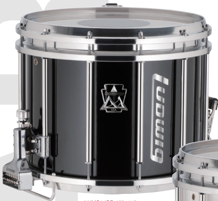
LUMS14PB 12"×14" Black