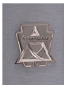
Brushed Grey Cortex