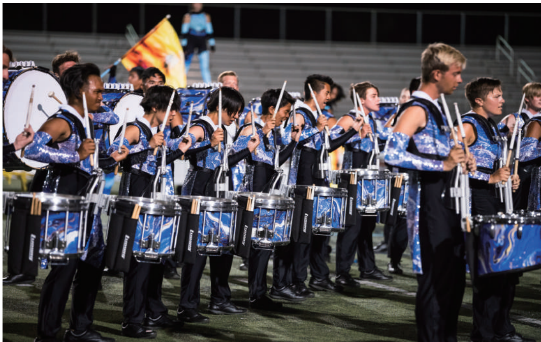
Blue Devils Drum & Bugle Corps

Blue Devils Drum & Bugle Corps / Southwind Drum & Bugle Corps / STRYKE / RCC Indoor Percussion / ConneXus / MBI Indoor Percussion など