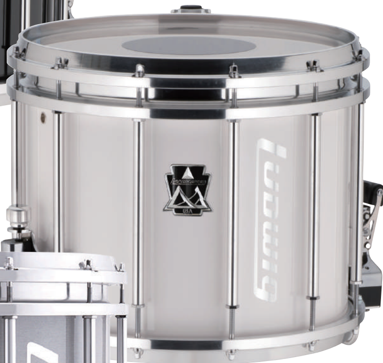
LUMS14PW 12"×14" White