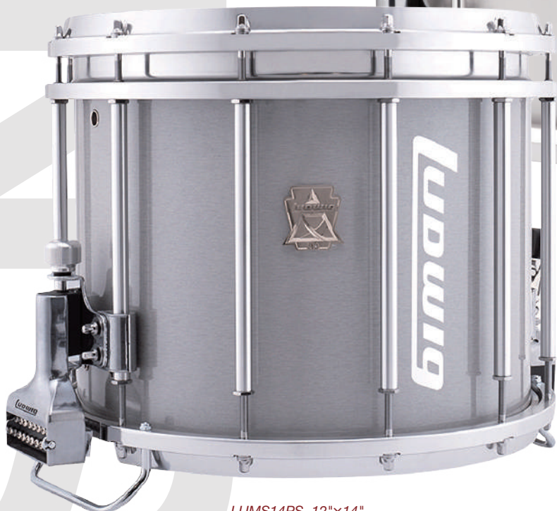
LUMS14PS 12"×14" Brushed Grey Cortex