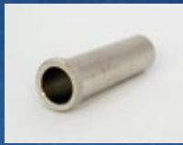
TRUMPET マウスピースアダプター 195T (コルネット→トランペット)