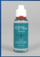
ロータリーオイル